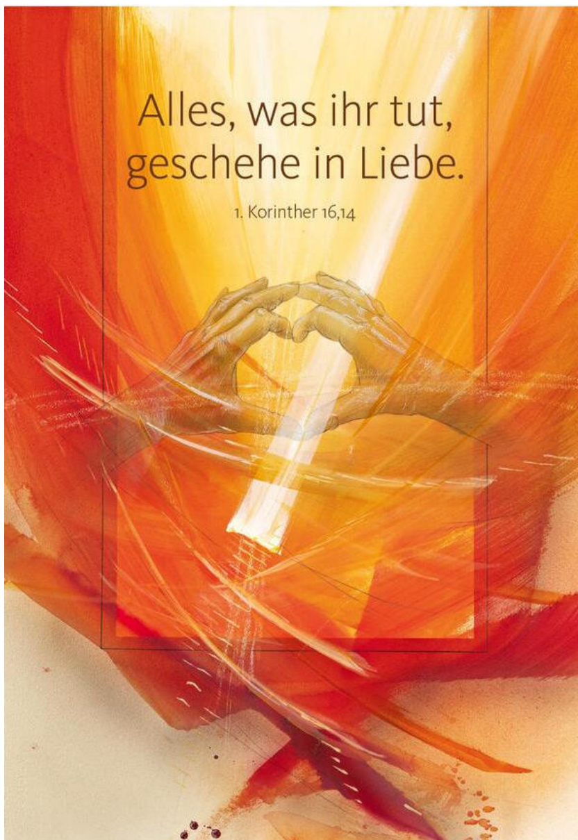
Grafik Eberhard Münch