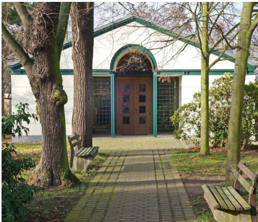
Auf dem Friedhof Knauthain, Bild: Siegfried Kuntzsch

Hilf du uns, Gott, unser Helfer, um deines Namens Ehre willen! Errette uns und vergib uns unsere Sünden um deines Namens willen! Psalm 79,9