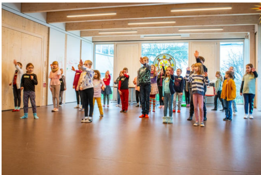
Bei den Musical-Proben

Junge Gemeinde (Meulenberg): freitags 19:00 Uhr oder nach Absprache