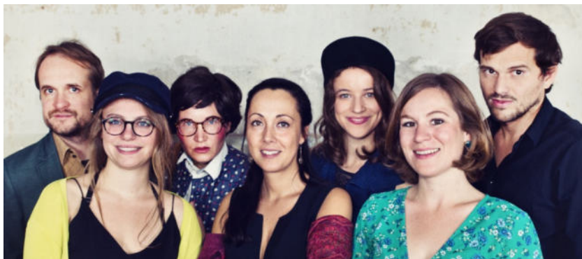
Combo CAM, Foto Babett Niclas

Eintrittskarten für den Kulturfreitag im Leipziger Südwesten erhalten Sie im Vorverkauf bei Musikalienhandlung M. OELSNER; Brückenapotheke; Optik Weiss; Seumeapotheke und in den Pfarrämtern Großzschocher und Knauthain zu 15 Euro, ermäßigt 10 Euro, Kinder bis 18 Jahre erhalten freien Eintritt. (Ermäßigungen für Auszubildende, Studierende, Leipzig-Pass-Inhaber. Rollstuhlfahrende und Schwerbehinderte mit „B“ im Ausweis bezahlen vollen Eintritt und die Begleitperson erhält eine Freikarte.)