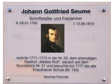
Haustafel in der Seumestraße

Im August macht der Frauendienst Sommerpause.