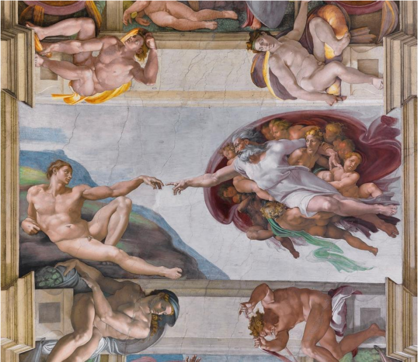
„Die Erschaffung Adams“ aus Michelangelos Deckenfresko im Vatikan

„Ich danke Dir dafür, dass ich wunderbar gemacht bin; wunderbar sind deine Werke; das erkennt meine Seele.“ Psalm 139,14